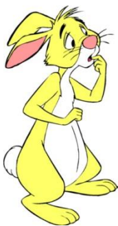
Rabbit /Рэ́ббит/ Кролик