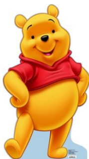
Winnie-the-Pooh /Уинни-зэ-Пу:/ Винни Пух

Пример: This is Tigger. This is his scarf. (перевод: Это Тигруля. Это его шарф)