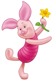
Piglet /Пиглэт/ Хрюня