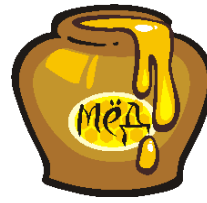
honey /ханни/ мёд