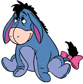
Eeyore /Ио:р/ Ослик Иа