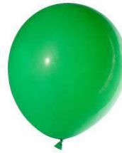
balloon /бэлЛУ:н/ воздушный шарик